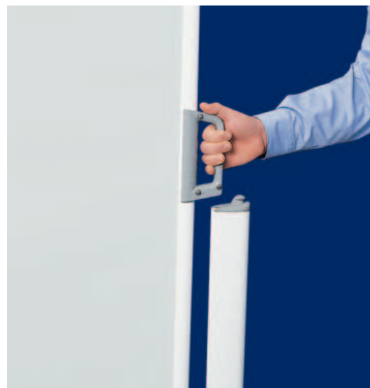
Modo de fijación de la lona extendida

+8 % de suplemento +8 % de suplemento +8 % de suplemento