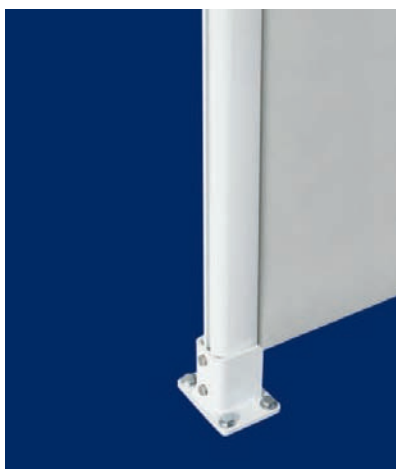
Anclaje al suelo