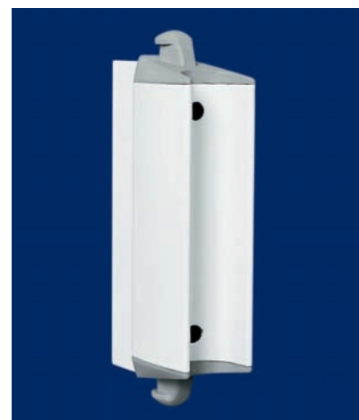
Fijación a pared para extender la lona

1. Ancho de lona / altura aproximada 162 cm