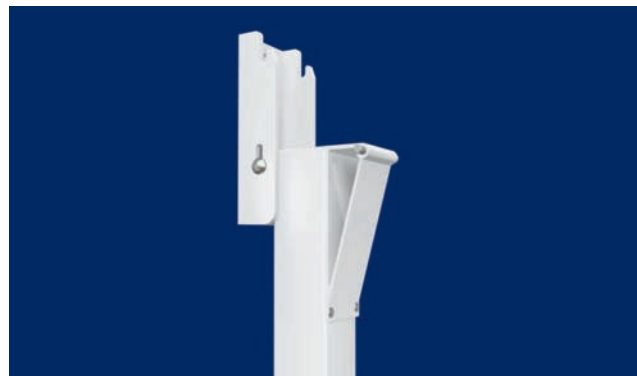
Sujeción plegada, en detalle