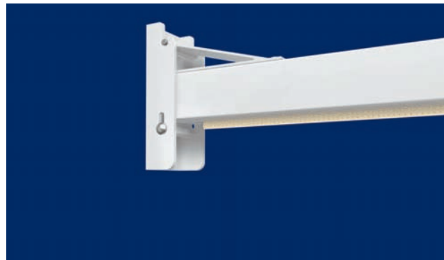
Sujeción plegada, en detalle