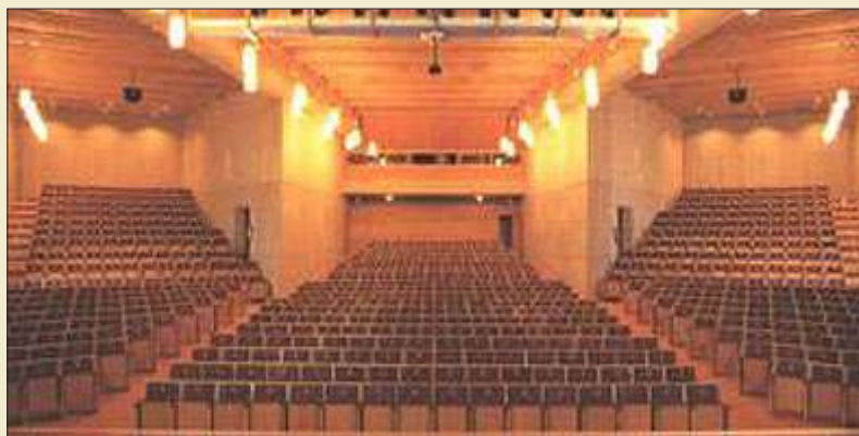
AUDITORIO MUNICIPAL - Colmenar Viejo (Madrid)